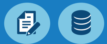
Vragenlijst onder 1.920 Syriërs en CBS-gegevens