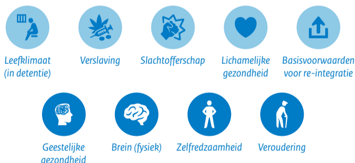
Domeinen waarop schade kan plaatsvinden bij (lange) detenties