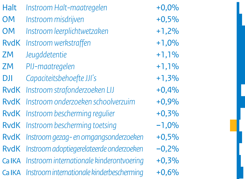
Figuur S5 Verwachte capaciteitsbehoefte strafrechtspraak jeugd (mutatie)*

* Het percentage is de gemiddelde mutatie per jaar in de periode 2025-2031.