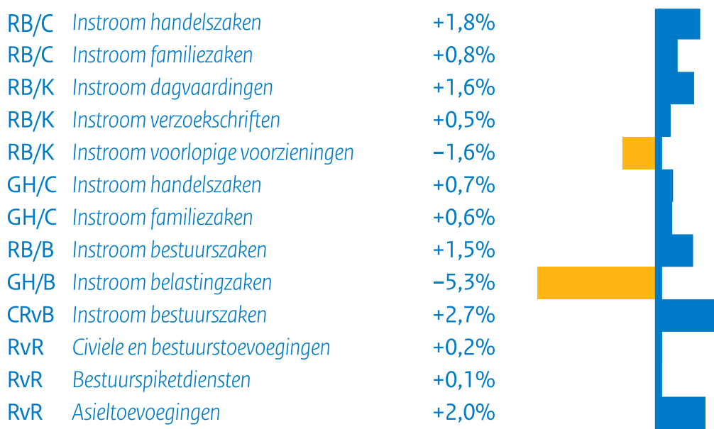
Figuur S7 Verwachte capaciteitsbehoefte civiele en bestuursrechtspraak (mutatie)*,**

* Het percentage is de gemiddelde mutatie per jaar in de periode 2025-2031.