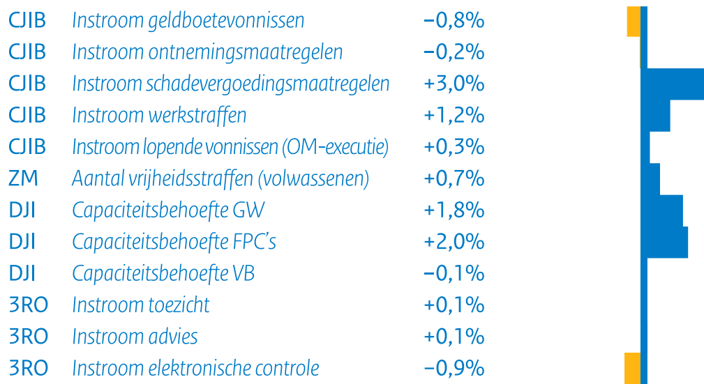
Figuur S4 Verwachte capaciteitsbehoefte tenuitvoerlegging (mutatie)*

* Het percentage is de gemiddelde mutatie per jaar in de periode 2025-2031.